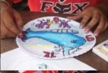
ပစ္စည်းပစ္စည်းများ စုစည်းပေးခြင်း