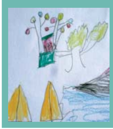
လမ်းညွှန်အားပေးမှု

အချိန်ကာလ ၉ မတ်လ ၂၀၁၅ မှ ၁၂ မတ်လ ၂၀၁၅ အချိန်ကာလ ၉ မတ်လ ၂၀၁၅ မှ ၁၂ မတ်လ ၂၀၁၅ အချိန်ကာလ ၉ မတ်လ ၂၀၁၅ မှ ၁၂ မတ်လ ၂၀၁၅